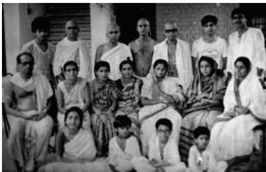
Picture of a Joint Hindu Family

ଏକ ଯୌଥ ହିନ୍ଦୁପରିବାର ସଦସ୍ୟଙ୍କ ଦ୍ୱାରା କରାଯାଇଥିବା ବ୍ୟବସାୟକୁ ଯୌଥ ହିନ୍ଦୁ ପରିବାର ବ୍ୟବସାୟ କହନ୍ତି । ଏହାକୁ ମଧ୍ୟ ଅବିଭକ୍ତ ହିନ୍ଦୁ ପରିବାର ବ୍ୟବସାୟ(HUF) କହନ୍ତି । ହିନ୍ଦୁ ଆଇନରେ ଏହି ପ୍ରକାର ବ୍ୟବସାୟ ବ୍ୟବସ୍ଥା ରହିଛି ଏବଂ ଉତ୍ତରାଧିକାରୀ ଆଇନ୍ ଦ୍ୱାରା ଏହା ପରିଚାଳିତ । ଯୌଥ ହିନ୍ଦୁ ପରିବାର ବ୍ୟବସାୟର ପରିବାର ପୈତୃକ ସ୍ୱତ୍ତ୍ୱରୁ ସମ୍ପତ୍ତି ପାଇଥାଏ । ଉତ୍ତରାଧିକାର ସ୍ୱତ୍ତ୍ୱରେ ପରିବାରର ପୁରୁଷ ଲୋକଙ୍କୁ ସମ୍ପତ୍ତି ମିଳେ । ବାପା, ଜେଜେ ବାପା ଏବଂ ତାଙ୍କ ପୂର୍ବ ପୁରୁଷଙ୍କ ଠାରୁ ମିଳିଥିବା ସମ୍ପତ୍ତିକୁ ନେଇ ବ୍ୟବସାୟ ଆରମ୍ଭ ହୋଇଥାଏ । ପରିବାରର ପୁରୁଷ ସଦସ୍ୟଙ୍କୁ କୋପାର୍ଟନର ବା ଅଂଶାଦାର ଏବଂ ପରିବାର ମୁଖ୍ୟଙ୍କୁ କର୍ତ୍ତା କୁହାଯାଏ ।