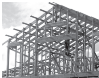
A Building under Construction

୫. ନିର୍ମାଣ ଶିଳ୍ପ: କୋଠା, ବନ୍ଧ, ବାଡ଼, ପୋଲ ଆଦି ନିର୍ମାଣ, ରାସ୍ତାଘାଟ ନିର୍ମାଣ କରୁଥିବା ଶିଳ୍ପକୁ ନିର୍ମାଣ ଶିଳ୍ପ କହନ୍ତି । ଏହା ଅନ୍ୟାନ୍ୟ ଶିଳ୍ପଠାରୁ ଭିନ୍ନ । କାରଣ ଅନ୍ୟାନ୍ୟ ଶିଳ୍ପ କ୍ଷେତ୍ରରେ ସାମଗ୍ରୀ ଗୋଟିଏ ସ୍ଥାନରୁ ପ୍ରସ୍ତୁତ ହେଉଥିଲାବେଳେ ନିର୍ମାଣ ଶିଳ୍ପରେ ପ୍ରସ୍ତୁତ ଓ ବିକ୍ରି ସାମଗ୍ରୀ ଗୋଟିଏ ସ୍ଥାନରେ ନିର୍ମାଣ କାର୍ଯ୍ୟରେ ଲାଗିଥାଏ ।