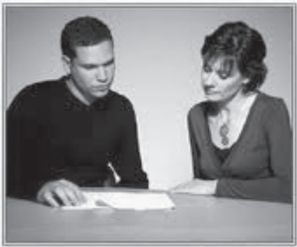
Picture of a Partnership

ତୁମେ ପଢ଼ିଛ ଯେ ଏକାକୀ ମାଲିକାନା ବ୍ୟବସାୟିକ ସଂଗଠନର କିଛି ଅସୁବିଧା ରହିଛି । ଏହାର ଆର୍ଥିକ ଓ ପରିଚ୍ଛଳନା ଗତ ସମ୍ବଳ ବହୁତ ସୀମିତ । ଏକ ନିର୍ଦ୍ଦିଷ୍ଟ ସୀମାର ଆଗକୁ ଏହି ବ୍ୟବସାୟ ବଢ଼ିବା ସମ୍ଭବ ହୁଏ ନାହିଁ । ଏକକ ମାଲିକାନା ବ୍ୟବସାୟୀକ ସଂଗଠନର ଏହିସବୁ ଅସୁବିଧାରୁ ମୁକ୍ତିପାଇବା ଲାଗି ଭାଗିଦାରୀ ବ୍ୟବସାୟ ସୃଷ୍ଟିହେଲା । ଆସ ଏହି ଭାଗିଦାରୀ ବ୍ୟବସାୟ ବିଷୟରେ ଜାଣିବା ।