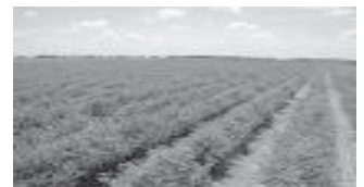
An Agricultural Farm

୧. ପ୍ରାଥମିକ ଶିଳ୍ପ ବା ପ୍ରାଇମେରୀ ଶିଳ୍ପ: ପ୍ରକୃତିକୁ ଆଧାର କରି ସାମଗ୍ରୀ ଉତ୍ପାଦନ କରୁଥିବା ଶିଳ୍ପକୁ ପ୍ରାଥମିକ ଶିଳ୍ପ କୁହାଯାଏ। ଏହା ପ୍ରକୃତି ସମ୍ପର୍କିତ ଶିଳ୍ପ। ଏଥିରେ ମାନବୀୟ ପ୍ରଚେଷ୍ଟା କମ୍‌ଥାଏ, ଉଦାହରଣ: କୃଷିକାର୍ଯ୍ୟ, ଫାର୍ମିଂ, ମାଛଝିଅ, ଉଦ୍ୟାନ କୃଷି, ଜଙ୍ଗଲଜାତ ଦ୍ରବ୍ୟ ସମ୍ବନ୍ଧୀୟ ଇତ୍ୟାଦି।