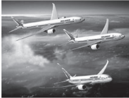
Picture of Air Transport

ଏହି ପରିବହନ ସବୁଠାରୁ ଦ୍ରୁତଗାମୀ ମାଧ୍ୟମ । ଯାତ୍ରୀ ଓ ମାଲ ବାୟୁ ମାର୍ଗରେ ବିମାନ ତଥା ହେଲିକପ୍ଟର ଯୋଗେ ହୋଇଥାଏ । ଏଥିରେ ଯାତ୍ରୀଙ୍କ ବ୍ୟତୀତ ହାଲୁକା ଓ ଦାମୀ ଜିନିଷ ପରିବହନ ହୋଇଥାଏ । ପାର୍ବତୀୟ ଅଞ୍ଚଳରେ ଯେଉଁଠି ପରିବହନର ଅନ୍ୟାନ୍ୟ ମାଧ୍ୟମଗୁଡ଼ିକ ସମ୍ଭବ ହୁଏ ନାହିଁ ସେଠାରେ ବାୟୁପରିବହନ ସୁବିଧାଜନକ ଓ ଗୁରୁତ୍ୱପୂର୍ଣ୍ଣ । ଭୂକମ୍ପ ଓ ବନ୍ୟା ଆଦି ପ୍ରାକୃତିକ ଦୁର୍ଘଟଣା ସମୟରେ ଯାତ୍ରୀ ଓ ବସ୍ତୁ ନେବା ଆଣିବା ପାଇଁ ଏହି ମାଧ୍ୟମ ଉପଯୋଗୀ ହୋଇଥାଏ । ଯୁଦ୍ଧ ସମୟରେ ବାୟୁ ପରିବହନର ଭୂମିକା ଅଧିକ ଗୁରୁତ୍ୱପୂର୍ଣ୍ଣ ହୋଇଥାଏ ।