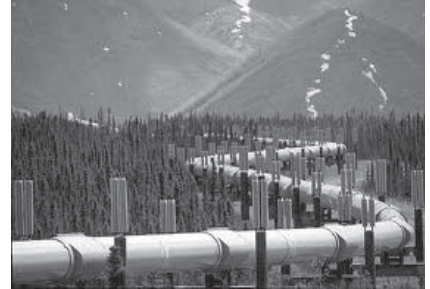
Pipe Line Transport

ଆଧୁନିକ ସମୟରେ ପାଇପ୍ ଲାଇନ୍‌କୁ ଭିନ୍ନ ଭିନ୍ନ ଉଦ୍ଦେଶ୍ୟ ଲାଗି ପ୍ରୟୋଗ କରାଯାଉଛି । ଘର ଓ ବ୍ୟବସାୟିକ ଅଞ୍ଚଳଗୁଡ଼ିକୁ ପାଣି ପାଇପ୍ ଯୋଗେ ପଠାଯାଇଥାଏ । ପେଟ୍ରୋଲିୟମ ବା ପ୍ରାକୃତିକ ଗ୍ୟାସ ଗୋଟିଏ ସ୍ଥାନରୁ ଅନ୍ୟସ୍ଥାନକୁ ଏହି ପାଇପ୍ ଲାଇନ୍ ମାଧ୍ୟମରେ ପଠାଯାଇଥାଏ । ସଡ଼କ ଓ ରେଳପଥ ତୁଳନାରେ ପେଟ୍ରୋଲିୟମ ଓ ପ୍ରାକୃତିକ ଗ୍ୟାସ ପଠାଇବା ପାଇଁ ଏହା ସବୁଠୁ ଭଲ ଓ ସୁବିଧା ଜନକ ଶସ୍ତା ମାଧ୍ୟମ । କିନ୍ତୁ ଏଥିରେ ଅଣାଯାଉଥିବା ବସ୍ତୁର ଅଧିକ ମାତ୍ରାର କ୍ଷତି ହୋଇଥାଏ । ଯାତାୟତରେ ଏହି ମାଧ୍ୟମ ପ୍ରତିଷ୍ଠା ଓ ରକ୍ଷଣାବେକ୍ଷଣ ଲାଗି ଅଧିକ ମାତ୍ରାରେ ପୁଞ୍ଜିନିବେଶ କରିବାକୁ ପଡ଼ିଥାଏ ।