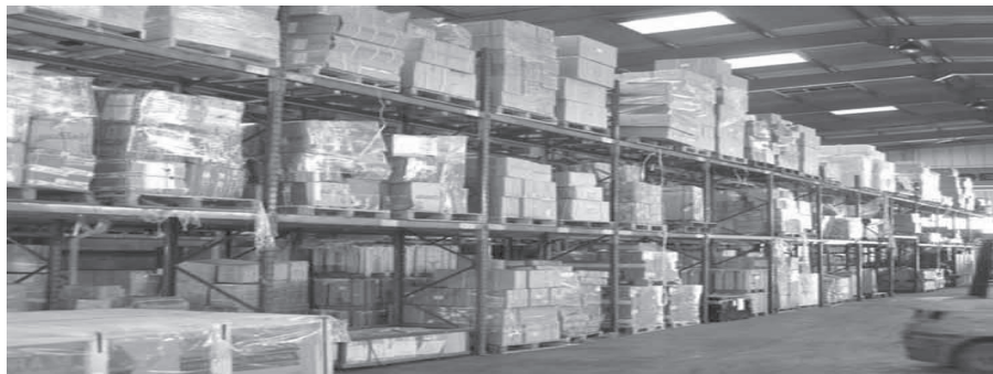
Goods Stored in a Warehouse