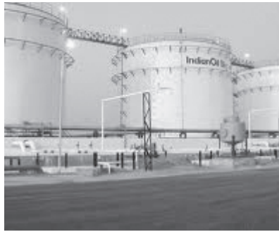
A Government Company