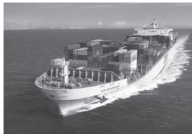
Picture of Ocean Transport

ମହାସାଗରୀୟ ପରିବହନ କହିଲେ ମହାସାଗର ମଧ୍ୟରେ ସାମୁଦ୍ରିକ ଜାହାଜରେ ଯାତ୍ରା ଓ ବସ୍ତୁର ପରିବହନକୁ ବୁଝାଯାଇଥାଏ । ଅନ୍ତରାଷ୍ଟ୍ରୀୟ ବାଣିଜ୍ୟର ବିକାଶରେ ଏହାର ସ୍ଥାନ ଅତି ଗୁରୁତ୍ୱପୂର୍ଣ୍ଣ । ଉପକୂଳ ଅଞ୍ଚଳରେ ଏହାଦ୍ୱାରା ଯାତ୍ରା ଓ ଜିନିଷପତ୍ର ପହଞ୍ଚାଇବା ଲାଗି ଏହି ମାଧ୍ୟମକୁ ଉପଯୋଗ କରାଯାଇଥାଏ । ମହାସାଗରୀୟ ପରିବହନର ମାର୍ଗ ନିର୍ଦ୍ଧାରଣ ରହିଥାଏ । ଏଥିରେ ପୃଥିବୀର ପ୍ରାୟ ସବୁଦେଶ ଯୋଡ଼ି ହୋଇ ରହିଛନ୍ତି । ମହାସାଗରୀୟ ପରିବହନ ଦୁଇପ୍ରକାରର ।