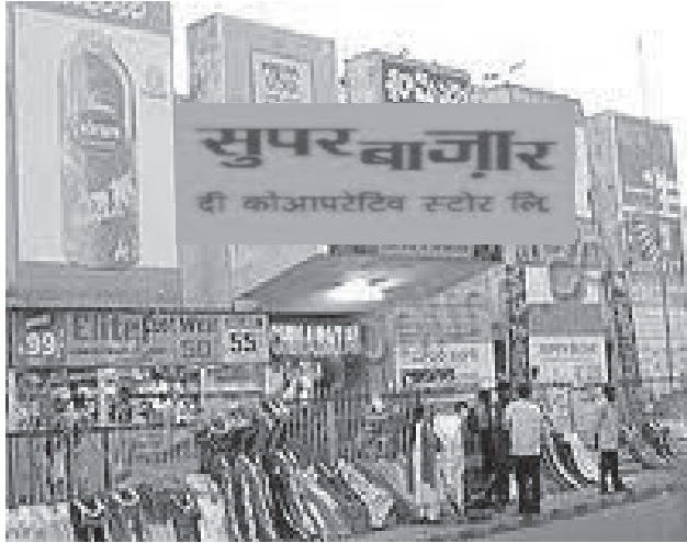
Picture of Cooperative Society

Co-operation (କୋ-ଅପେରେସନ) ଶବ୍ଦ ଲାଟିନ ଶବ୍ଦ Co-operari ରୁ ଆସିଛି, ଯେଉଁଥିରେ “Co” ଅର୍ଥ ସହିତ ବା ଏକାଠି ଏବଂ ‘operation’ ଅର୍ଥ ଏକାଠି କାର୍ଯ୍ୟ କରିବା। କୌଣସି ଏକକ ଲକ୍ଷ୍ୟରେ କାର୍ଯ୍ୟ କରିବା ପାଇଁ ଆଗଭର କିଛି ବ୍ୟକ୍ତିଙ୍କୁ ନେଇ ଗଠନ କରାଯାଇଥିବା ସମିତିକୁ ସମବାୟ ସମିତି ବା Co-operative Society