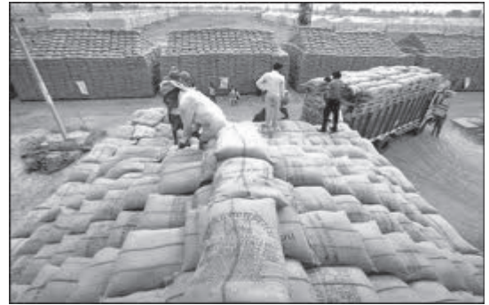
Goods in a Warehouse

ବର୍ଷସାରା ଥାଏ, ତେଣୁ ଆଖୁ ଯୋଗାଣ ବର୍ଷସାରା ହେବା ଦରକାର । ଏପରି କିପରି ସମ୍ଭବ ହୋଇପାରିବ ? ଏ ପରିସ୍ଥିତିରେ ଆଖୁର ଉପଯୁକ୍ତ ପରିମାଣରେ ଭଣ୍ଡାର ଆବଶ୍ୟକ । ଏହା ବ୍ୟତୀତ ଚିନି ଉତ୍ପାଦନ ପରେ ଏହାର ବିତରଣ ଓ ବିକ୍ରୟ ପାଇଁ ସମୟ ଦରକାର । ଏହିପରି କଞ୍ଚାମାଲ ଓ ଉତ୍ପାଦିତ ମାଲ ଉଭୟ ପାଇଁ ମହଜୁଦର ଆବଶ୍ୟକତା ପଡ଼େ ।